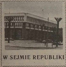
W SEJMIE REPUBLIKI

W tym samym posiedzeniu plenarnym minister sprawiedliwości Prapetis zgłosił projekt ustawy „O uzupełnieniu i zmianie artykułu 213 Kodeksu rodzinnego i opiekuńczego”.