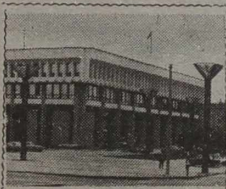
W SEJMIE REPUBLIKI

Zgłoszono projekt uchwały „O częściowej zmianie uchwały Sejmu Republiki Litewskiej „O zawieszeniu pełnomocnictw posła na Sejm Republiki Litewskiej A. Brazauskasa”. Ponieważ poczyniono zmiany w ustawie o wyborach do Sejmu oraz przedłożono utworzenie Głównej Komisji Wyborczej, komisja ta poprosiła, aby zezwolono jej wybory w Koszodarskim Okręgu Wyborczym nr 59 przeprowadzić o miesiąc później.