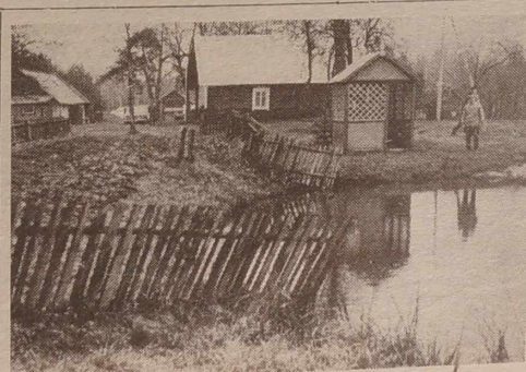
Oznaki wiosny na Wileńszczyźnie.