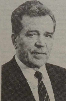
rium, które państwo wykupuje na rozwój miasta lub osiedla typu miejskiego — dwukrotnie.

6. Jeżeli posiadana ziemia o przeznaczeniu rolniczym (tj. posiadłość ziemską gospodarza) znajduje się w obecnych granicach miast lub osiedla typu miejskiego, obliczoną cenę ziemi zwiększa się trzykrotnie, a jeżeli ziemia jest na teryto-