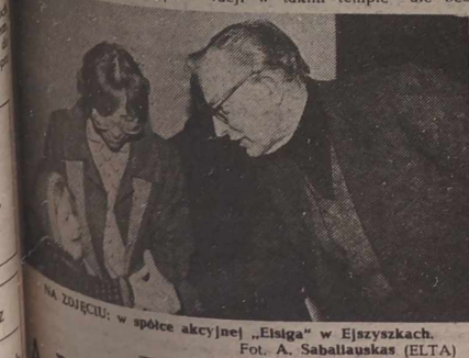
NA ZDJĘCIU: w spółce akcyjnej „Eisiga” w Ejszyszkach.

W Ejszyszkach spotkał się z wyborcami kandydat na prezydenta Litwy Stasys Lozoraitis. Można było otrzymać tamże pamiatkowe znaczki z portretem kandydata i przeczytać, jednakże szczególnym zainteresowaniem cieszyły się kalendariusze na rok wyborów prezydenckich z napisem „Ejszyszki: Stasys Lozoraitis”. Sam kandydat wszedł z żoną i dwiema dziewczynkami do sali konferencyjnej. W tym czasie Lozoraitis przywitał się w wielu kwestiach, głównie tych, które skłamały na jego platformie przedwyborczej. Powiedział, że odwiedził już wiele regionów i zapoznał się z sytuacją. Ekonomista, który pracował z pracą myślową, mówił o stosunkach z zagranicą. Podkreślił, że Litwa po-