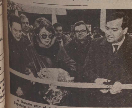
W Kownie przy ul. S. Daukanta 27 wciągnięta została flaga Republiki Łotwy, otworzył ją przedstawicielstwo handlowe. W ZDJĘCIU: fragment uroczystości otwarcia przedstawicielstwa.