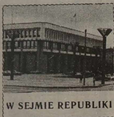
W SEJMIE REPUBLIKI

Przyjęto tymczasową ustawę Republiki Litewskiej „O niektórych kwestiach zorganizowania pracy Sejmu Republiki Litewskiej”.