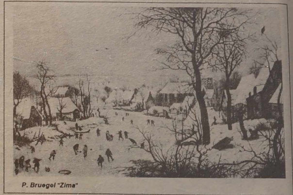
P. Bruegel "Zima"

3. Pytam, która godzina, potem, jak się dziewczyna nazywa, czy ma samochód. Jeżeli