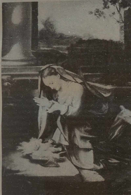
A.A. Corregio "Wielbienie Chrystusa"