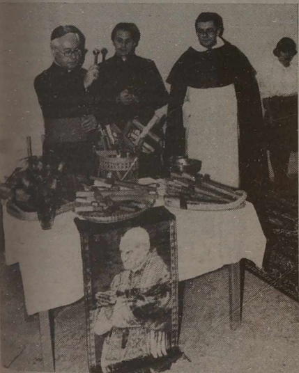
NA ZDJĘCIU: nuncjusz papieski wyświęca szkołę.

— To drugie "tak" jest głośniejsze — śmieje się nuncjusz. Właśnie w ten sposób, serdecznie, swobodnie, z miłością do dzieci rozpoczął swą przemowę nuncjusz. Przy spotkaniu z Ojcem Świętym, powiedział, opowiem mu o tej uroczystości, o szkole, która nosi jego imię. Poproszę o (Dokończenie na str. 3)