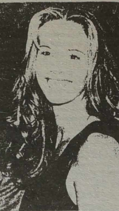
cię kochać jeszcze bardziej" — piszą do swej idolki. Czy wysłucha ich, nie wiadomo.