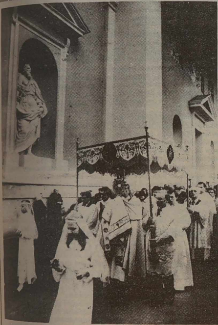
Migawki ze Świąt Wielkanocnych

Żaluzje, sprzęt oświetleniowy. Tel./fax. 77-36-16, Vilnius.