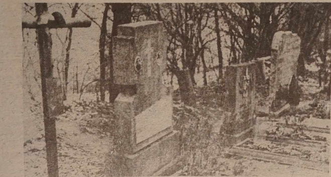
NA ZDJĘCIACH: przy zbiorowym grobie Polaków pomordowanych w Gliniszczach z dodaną nie zmienionym napisem po rosyjsku: „Zalicz pochoronyeniy żertvy faszyzma rasstrielannye 20 Junia 1944 r. 38 ezhelovok”; zbiorowe groby Litwinów pomordowanych w Dubinkach.