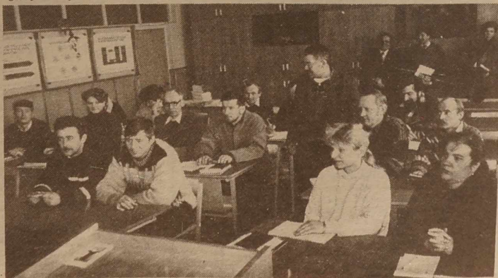
NA ZDJĘCIU: słuchacze Kursu podczas zajęć z sadownictwa.

W tych dniach MSZ otrzymało notę Ambasady Republiki Federalnej Niemiec z informacją, że Niemcy już honorują dokumenty podróży dziecka i po ich złożeniu wydają wizy.