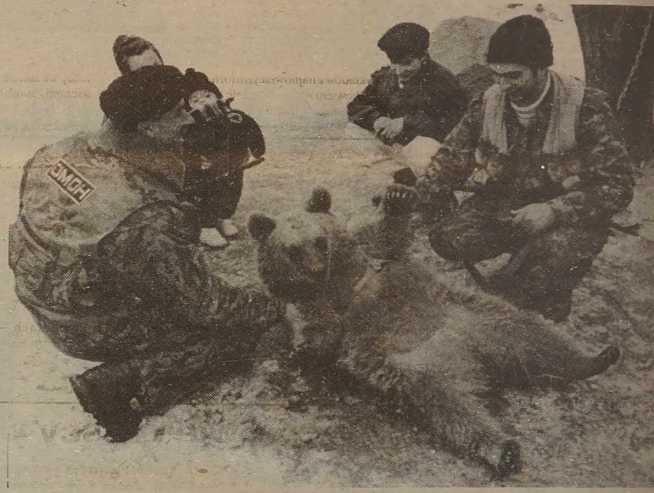
Trwająca już ponad rok wojna w Czeczenii nie jest tylko i wyłącznie pasmem tragicznych i smutnych wydarzeń. Na wojnie