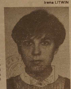
Przygotowała Irena LITWIN