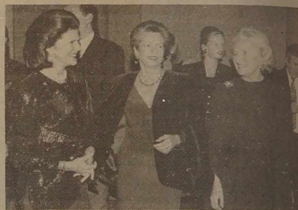
Wersal. Królowa Sylwia, żona byłego prezydenta Francji Anne-Agmonne Giscard d'Estaing i żona obecnego prezydenta Bernarda Hiriaca uczestniczą w uroczystym obiedzie, poświęconym zakończeniu międzynarodowego forum nt. praw dziecka.