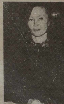
rze zza między — tancerze z Litewskiego Teatru Opery i Baletu z Teatru "Estonia". Wspólny występ tych trup baletowych razem z artystami Litewskiego Teatru Opery i Baletu oraz tancerzami Wileńskiej Szkoły Baletowej

Nieliczna grupa ludzi luboaterska podjęła się karkołomnego trudu, żeby ta impreza doszła jednak do skutku. W koncercie udział wzięli artyści z Opery Paryskiej, z Niemiec (Stowarzyszenie Baletowe w Bonn), z Rosji (Teatr Wielki i Maryjski z Sankt-Peterburga oraz Teatr Muzyczny im. K. Stanisławskiego i W. Niemirowski-Danczenki). Ponadto — także tance-