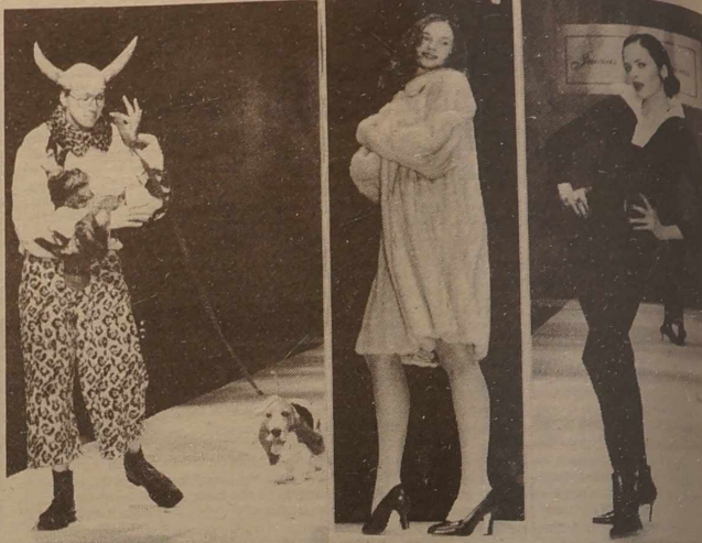
Tradycyjny festiwal "Dieni"