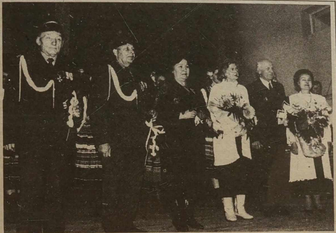
Centrum Kultury Polskiej na Litwie — organizatorem akademii z okazji Święta Niepodległości Polski