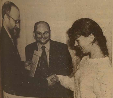
NA ZDJĘCIU: podczas wręczania stypendiów.