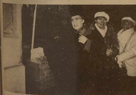
Maja Komorowska — wspaniała aktorka. Znana nam z filmów "Życie człowieka", "Za ścianą", "Bilans kwartału", "Panny z Wilka" i in., jak zawsze przejawia się w czołowie najczęściej zbierających na ratowanie Powązek. A w tym roku była aktorka związana była z Wilnem (m. in. mieszkała jako dziecko w Warszawie). W tym roku na warszawskiej kwestie zebrano na rzecz Rossy prawie 50 mln st. zł. Co jest sumą niebagatelną, zważając, że tegoroczna kwesta trwała jeden dzień (zdarzały się uprzednio nawet — trzy), a pogoda była typowo jesienna, nie skąpiąca deszczu.