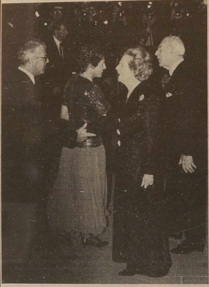
16 października była brytyjska premier baronowa Margaret Thatcher obchodziła swe 70 urodziny. Na przyjęciu urodzinowym była obecna śmietanka polityczna Wielkiej Brytanii.

NAZDZIĘCIU: obecny premier John Major składa urodzinowe życzenia swej poprzedniczce.