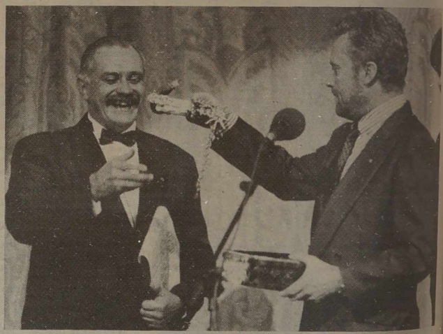
W sobotę w Moskwie hucznie świętowano 50 urodziny słynnego aktora i reżysera filmowego Nikity Michałkowa. Za film "Zmęczeni