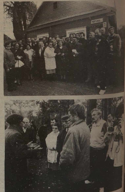
Zagładzie Inteligencji miasta 20 maja 1942 r.