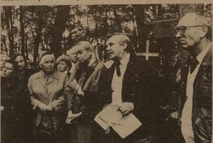
NA ZDJĘCIU: podczas zwiedzania Cmentarza Bernardyńskiego.