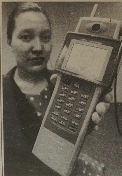
NA ZDJĘCIU: japońscy inżynierowie z firmy Panasonic zaferowali konsumentom nowy wynalazek w dziedzinie łączności. Przenośny wideo-telefon z kolorowym monitorem.