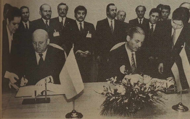
NA ZDJĘCIU: podczas podpisanie umowy o współpracy transgranicznej.