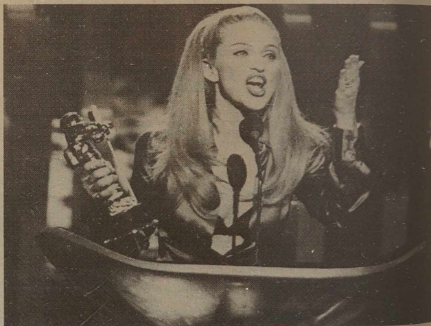
NA ZDJEŃCIU: słynna aktorka i piosenkarka amerykańska Madonna wjechała w Nowym Jorku nagrodą muzycznym kanału telewizyjnego MTV za 1995 r.