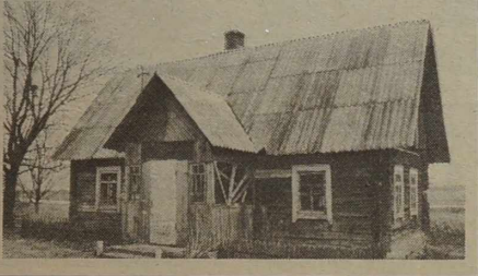
Irena LITWIN