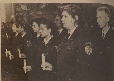
się w tej uczelni dopiero w poniedziałek.

Studenci i wykładowcy WUP postanowili przedłużyć wakacje o jeden weekend: uroczystości związane z początkiem roku akademickiego odbędą