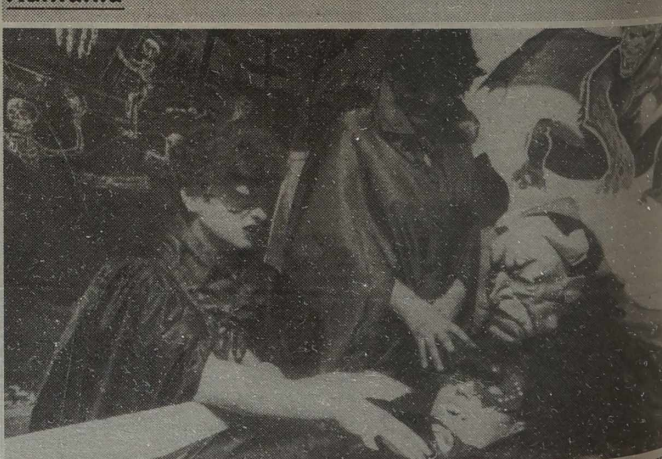
Zakończył się światowy kongres wielbicielów legendarnego wampira z Siedmiogrodu, hrabiego Drakuli. Na kongresie który rozpoczął się w Bukareszcie, a potem wędrował po zamkach Transylwanii, nie brakowało mrożących krew w żyłach zwierząt z życia wampirów i innych potworów. Jedno z takich przedstawień widzimy na zdjęciu.