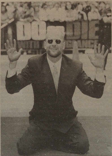
NA ZDJĘCIU: amerykański gwiazdor Bruce Willis po premierze filmu "Die Hard with Vengeance" w Los Angeles zostawia odciski swych dłoni na alei zasłużonych przed Chińskim Teatrem Mann. Ta tradycja utrzymuje się w Los Angeles od 1927 roku.