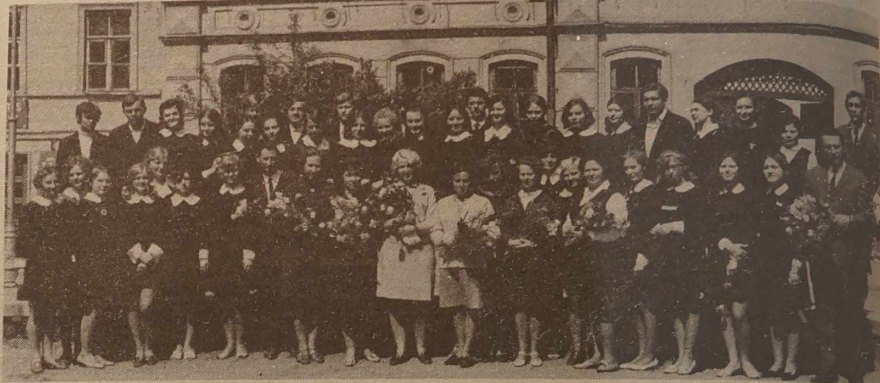
XII promocja składała maturę jeszcze na Witkomińskiej.

W r. 1982 kierownictwo szkoły objął nierzep podpisany. Byłem dumny, że powierzono mi placówkę o wieloletnich tradycjach, placówkę, której pracownikami byli tacy pedagodzy, jak