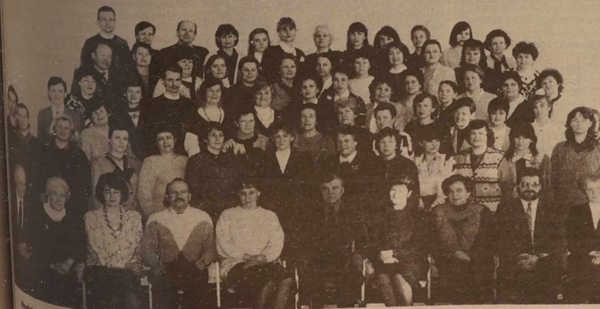
Wieloletni zrodziny grona pedagogicznego Wileńskiej Szkoły Średniej im. Wł. Syrokomli A.D. 1995. Publikacja poświęcona 40-leciu szkoły zamieszczamy na str. 6-7.