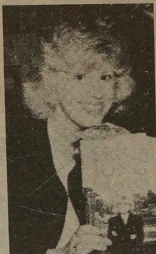
"strach przed pięćdziesiątką" jest trojęk kotekierjnyj