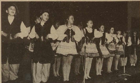
Młodsza grupa też się pięknie popisała