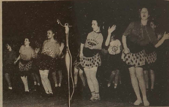
Współczesny taniec "Tęcza, tęcza, cza ... cza ... cza" dosłownie rozruszał całą widownię.