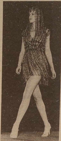
Suknia od Paco Rabanne'a.