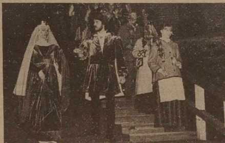
"Barbara Radziwiłłówna" i "Zigmunt August" otwierają festiwal mody na Zamku Trockim.