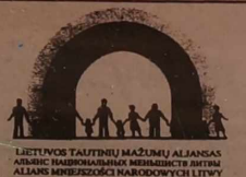
LIETUVOS TAUTINIŲ MAŽUMŲ ALIANSAS ALIANS MĖNIEŠOŠIŲ NARODOWIŲ LITWY

Partia aktywnie przygotowuje się do wyborów samorządów. Liczymy na Wasze poparcie, drodzy Wyborcy, i jesteśmy przekonani, że biorąc pod uwagę nasze możliwości oraz własne nadzieje przegłosujecie na nas. Samorządy — to bezpośredni kontakt z wyborcami. To nie długotrwałe dyskusje polityczne ze spornymi ustaleniami, lecz