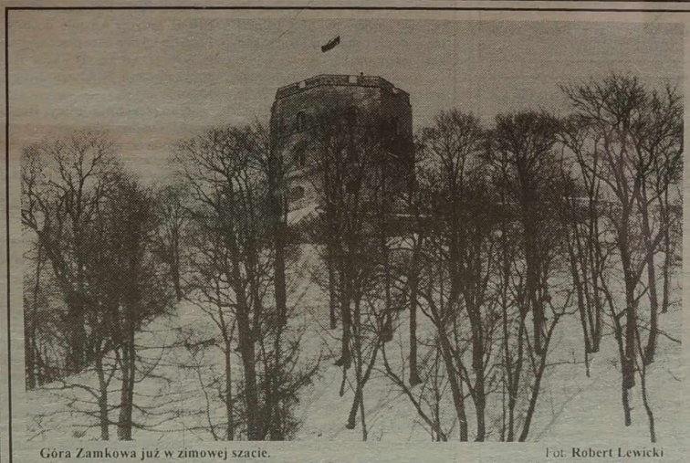
Góra Zamkowa już w zimowej szacie.