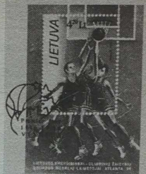
sowana specjalnym datownikiem pierwszego dnia — "premier jour".