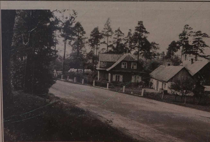
Migawki podwileńskie. Kowalczyki.