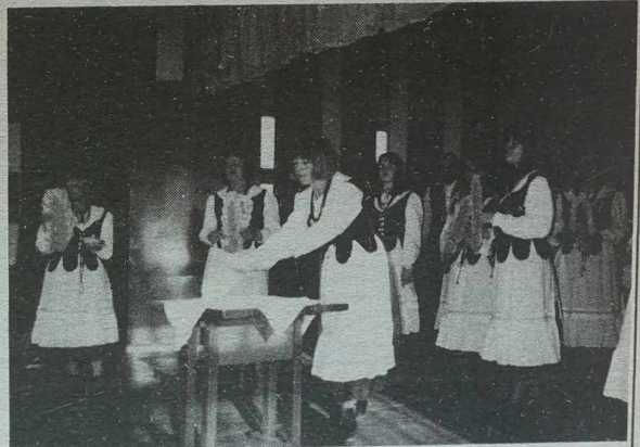
Na scenie tańczy i śpiewa zespół "Landwarowanie"

ba podkreślić, że każda ekspozycja zadziwiała gustem i pomysłowością, przy tym była specjalistyczna. Przykładowo w ekspozycji z Grzegorzewa dominowały dania z wazryw. Na stole połuknian podstawowym surowcem wszystkim wszystkim "smakotyków" było mleko. Gospodynie ze Starzych Trok prezentowały przetwory mięsne. Ekspozycją, wzbudzającym powszechne zainteresowanie, była faszerowana głowa wieprzowa. Troczanie zaprezen-