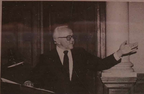
Uniwersyteckim Szpitalu w Santaryszkach.

— W aspekcie światopoglądu chrześcijańskiego większość Litwinów i Polaków jest jednorodną. Kościół jest dla nas autorytetem moralnym, aczkolwiek nie utożsamiam się go z partią lub partiami. Nowoczesne spojrzenie Po-