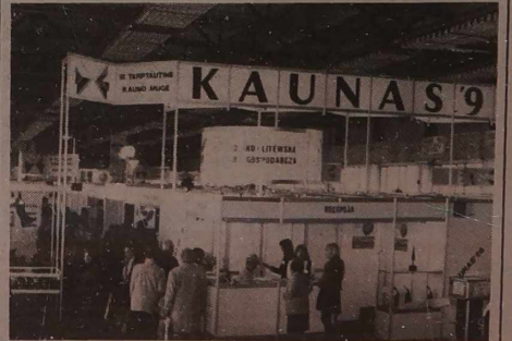
NA ZDJĘCIACH: stoisko firmy Energopol-Trade-Północ Sp. z o.o., laureata "Wstęgi Niemna"; stoiska produkcyjnej firmy "Zajda" z Łodzi; ogólny widok targów.