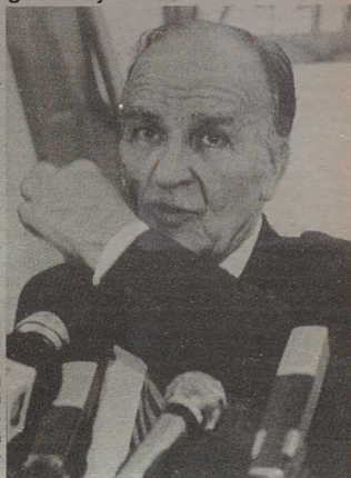
sprawiedliwości. Federacja muzulmańsko-chorwacka i Republika Serbska będą (czy miały własne rządy). Skład rządu centralnego zatwierdza Izba Reprezentantów, tj. niższa izba wspólnego parlamentu.

Prezydium ustala wspólną politykę zagraniczną. Mianuje centralną Radę Ministrów, która jako jedyna ma być odpowiedzialna za politykę zagraniczną, handel zagraniczny, gospodarkę i wymiar