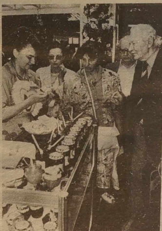
Wystawa - Targi będą klientem do 22 czerwca br. włącznie.