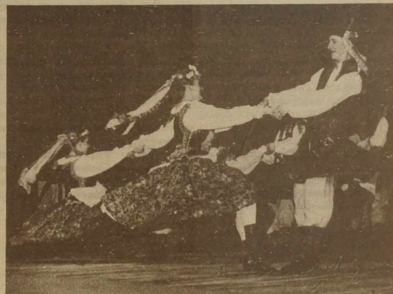
Aktualni tancerze tańczą nigdy nie starzejącego się "Krankowiaka"