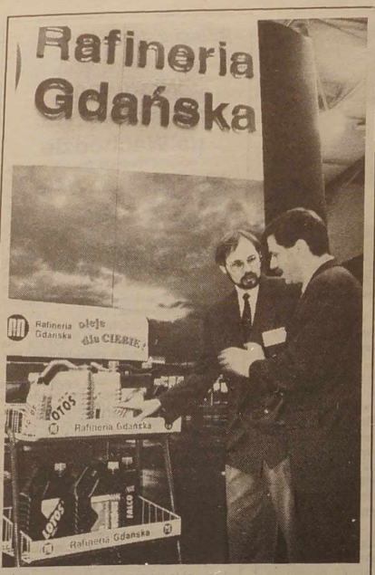
Jak już informowaliśmy, wczoraj w gmachu "Litexpo" otwarto dwie międzynarodowe wystawy-targi. "Transbaltica'96" oraz "Christiansova AB" z księżką Kristianad z Szwecji. Jeśli Szwecja prezentuje wyroby z różnych dziedzin, ale raczej drobne, to "Transbaltica'96" przedstawia szeroki profil wielkiego rodzaju sprzętu drogowego oraz smarów i olei samochodowych. Bogaty wybór tych ostatnich proponuje polska firma "Turdus" z Rafinerii Gdańskiej.