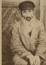
szlachcizna zagonowy — Polak; Żyd z Wilna; Białorusin spod Klecka (pow. shecki).