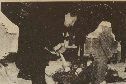
Aleksander Kwaśniewski na Cmentarzu Antokolskim przy grobach polskich żołnierzy poległych w latach 1919-1920.