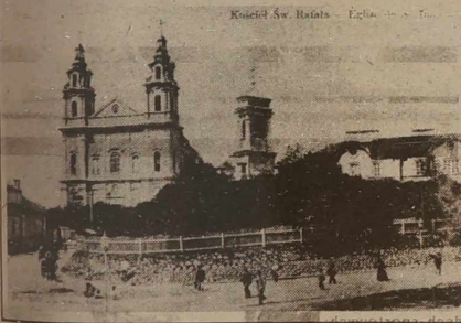
Kościół św. Rafała - Egla.