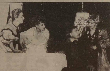
kasie wileńskiej "Rusdrymy" (ul. Basanavičiaus 13).

10 marca br. "Grube ryby" będzie miał obłąkane obręcze widz wileński. Przedstawienie będzie grane na scenie wileńskiego Rosyjskiego Teatru Dramatycznego. Bilety na spektakl w Wilnie można już w tym czasie nabyć w