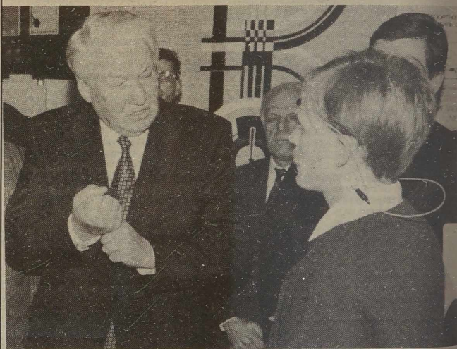
25 stycznia w Tatjanin dzień, który jest świętem rosyjskich studentów, prezydent Rosji Borys Jelcyn odwiedził Moskiewski Uniwersytet Techniczny, gdzie się zapoznał z życiem studentów tej uczelni.

Jak widzimy na zdjęciu, rosyjski przywódca w bardzo wyraźny sposób zademonstrował studentom, że zrozumieli tajemnicze ich badań naukowych.