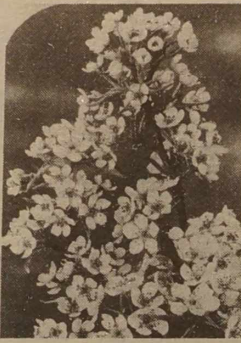
Kwitnąca wiśnia — jeden z okazów oferowanych przez firmę.

W Polsce wobec środowiska naturalnego w sensie użytkowym i rekreacyjnym wykazuje się duża troskę. W miastach ogrody mają przeważnie charakter dekoracyjny — zielony, równy trawnik, regularnie pielęgnowany (strzyżony), a na nim różnorodne krzewy ozdobne, iglaste (zimną zielono) oraz liściaste o różnej porze kwitnienia. Otoczenie takie jest doskonałą ucieczką od codziennej rzeczywistości, stwarza doskonałe miejsce do wypoczynku. Znaczną jest również liczba osób, która uprawia drzewa i krzewy owocowe. Liczba ta ciągle rośnie, ponieważ nabywcy przekonali się o ich niezwykłych wartościach (np. borowka wysoko: duża zawartość witaminy C, poprawia ostrość widzenia). Z innych atrakcji można wymienić jeżynę bezkolową, o dużych owocach, doskonałą w smaku.