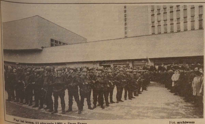
Pięć lat temu, 11 stycznia 1991 r. Dom Prasy.