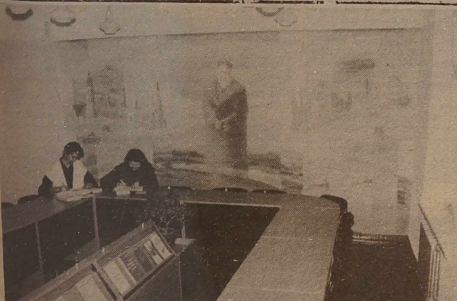
Z okazji 135 rocznicy urodzin (1860-1930) Jonasza Jablonskisa mieszkańcy Szawel uczcili pamięć wybitnego językoznawcy...

bie. Pod koniec tygodnia możliwa jest ciekawa wyprawa poza miasto, być może z dawną znajomą...