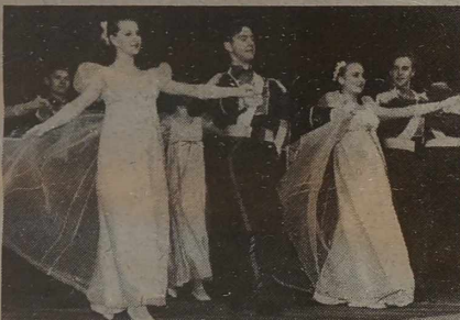
NA ZDJĘCIACH: fragmenty koncertu "Wili" na pożegnaniu staro roku i moment przekazania dokumentów i kluczyków od Ikarusa.