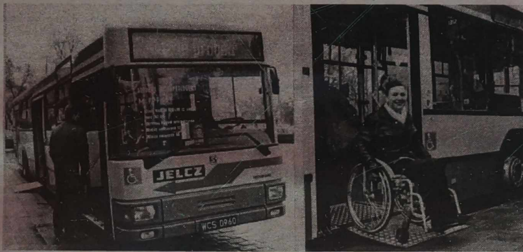
NA ZDJĘCIACH: autobus rodem z marzeń; chwila komfortu i nadziei.