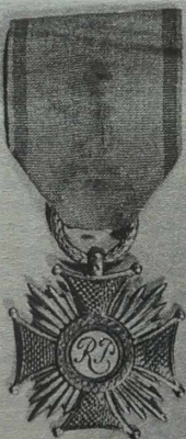
NA ZDJĘCIU: Krzyż złoty

Posiada 3 stopnie: Krzyż złoty, Krzyż srebrny i Krzyż brązowy, ten ostatni nosi się na zwykłym kółku, w środku zamiast ornamentacji, wieniec z liści laurowych. Odnaczenie krzy- żem mogło nastąpić czterokrotnie.