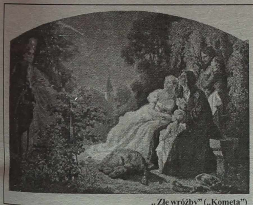
„Złe wróżby” („Komety”)

Coraz bardziej wzrasta za interesowanie pocztówką mi wśród historyków ponieważ są traktowane jako pełnowartościowy materiał źródłowy.