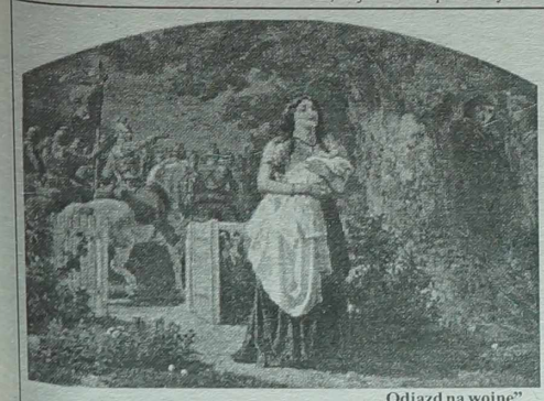
„Odjazd na wojnę”

Następny numer „Kolekcjonera” ukaże się 14 stycznia 1998 r.