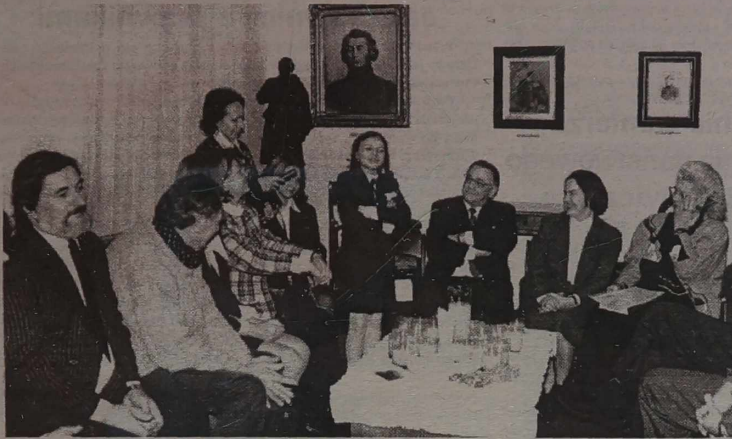
W Mieszkaniu-Muzeum Adama Mickiewicza w Wilnie w dniu 142 rocznicy śmierci poety