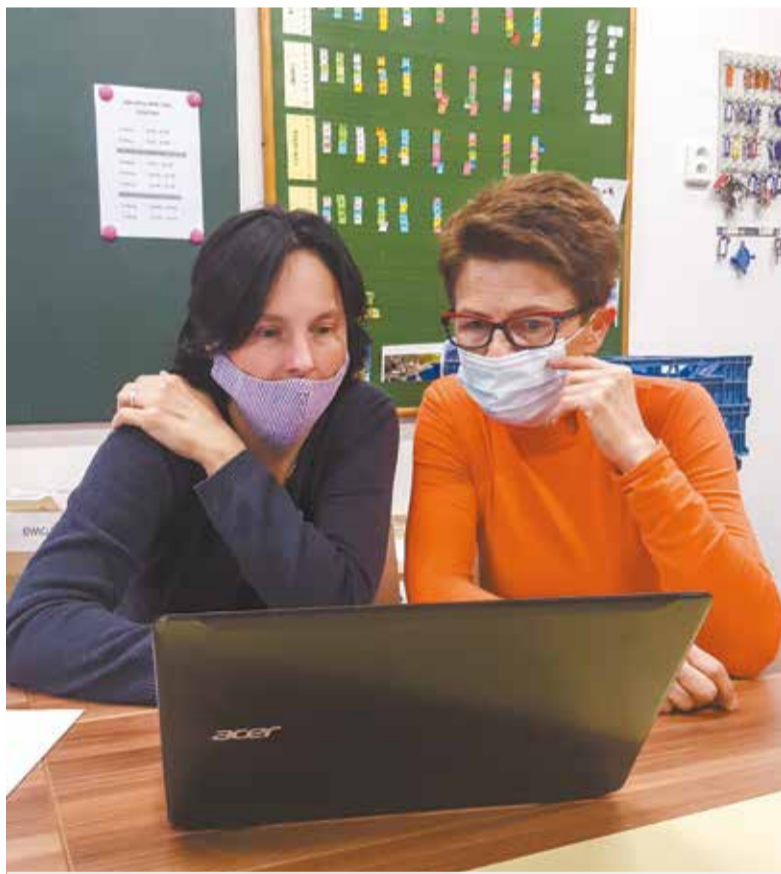
• Od środy we wszystkich szkołach w RC rozpoczęło się nauczanie zdalne. Nauczycielki z Polskiej Szkoły Podstawowej w Suchej Górnej łączyły się od rana ze swoimi uczniami przez platformę Google Classroom.

W związku z zamknięciem szkół na terenie naszego województwa zostanie ograniczony transport publiczny. Od poniedziałku autobusy będą kursowa-