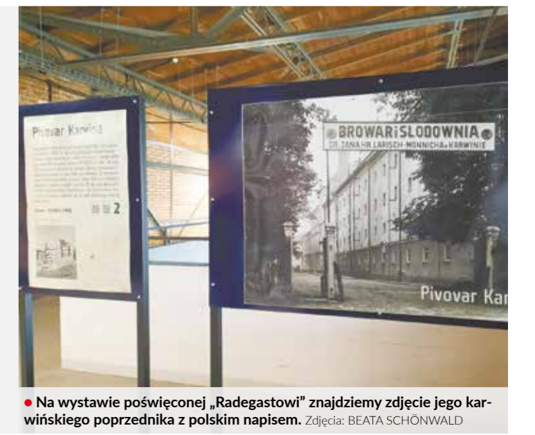
• Na wystawie poświęconej „Radegastowi” znajdziemy zdjęcie jego karwińskiego poprzednika z polskim napisem.

Jedynym browarem, który powstał w okresie socjalistycznej Czechosłowacji i przetrwał do dziś, to noszowicki „Radegast”. 3 grudnia br. upłynie dokładnie pół wieku od jego założenia. Jego historię przedstawia wystawa czasowa, która została zainstalowana z okazji wrześniowego otwarcia Muzeum Żywności i Maszyn Rolniczych. – Po likwidacji browaru w Karwinie powstało pytanie, kto będzie dostarczał piwo ciężko pracującym ludziom zatrudnionym w przemyśle. Zapadła decyzja, by wybudować nowy browar w Noszowicach – czytamy na jednym z paneli umieszczonych w foyer ostrawskiego muzeum. Wystawa pozwala zapoznać się z unikatową w swoim czasie technologią warzenia piwa, z tradycją knajp piwnych oraz historią już nieistniejących browarów, które działały na terenie dzisiejszego województwa morawsko-śląskiego. Pokazuje również, jak zmieniło się logo noszowickiego browaru, butelki i etykiety.