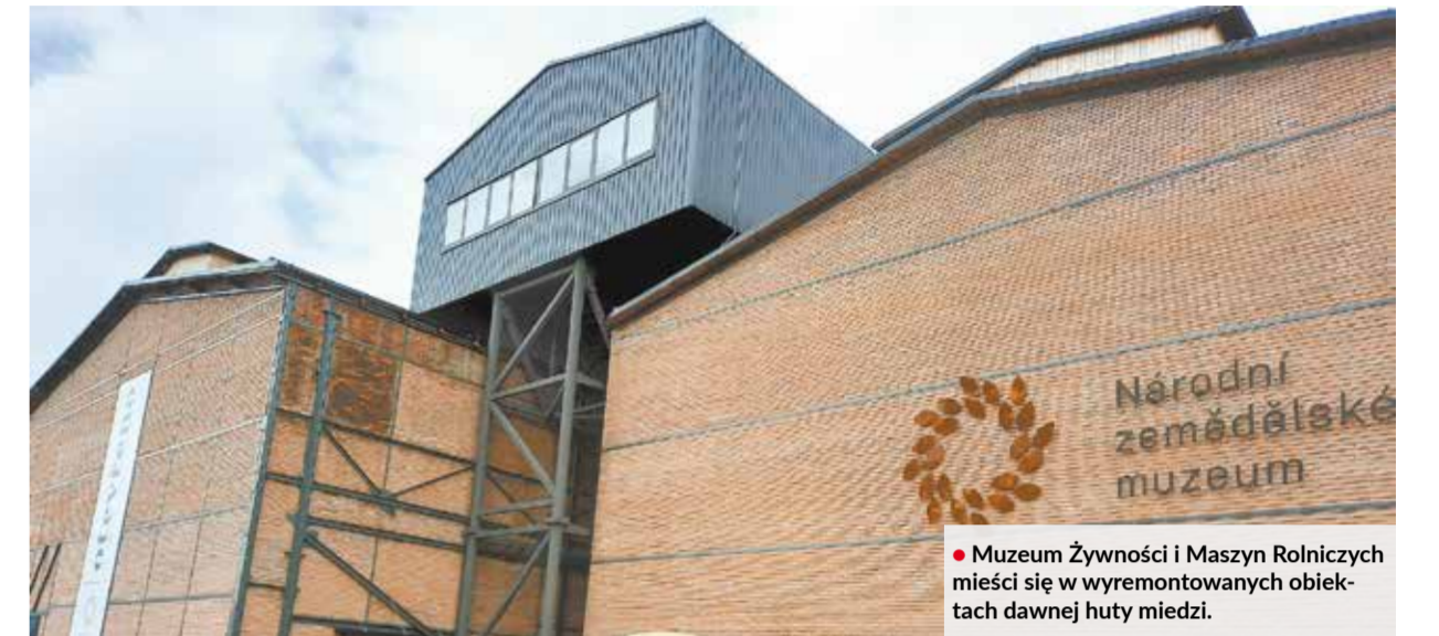
• Muzeum Żywności i Maszyn Rolniczych mieści się w wyremontowanych obiektach dawnej huty miedzi.

W drugiej części pomieszczenia została zainstalowana Galeria Czeskiej Żywności. Każdy z dziesięciu podstawowych produktów spożywczych ma tu swojego przedstawiciela. Są napoje alkoholowe i beزالkoholowe, przetwory mleczne, pieczywo, mięso, ryby, delikatesy, słodycze. Każdy produkt umieszczony jest w osobnej szklanej witrynie. Jedną trzecią z nich pochodzi z naszego regionu, reszta z pozostałych województw. Część została wyprodukowana przez duże wytwórnie, część przez mniejsze przedsiębiorstwa i firmy rodzinne. To, co je łączy, to czeskie pochodzenie, posiadanie certyfikatu jakości lub statusu produktu regionalnego. Aby zaprezentować jak najlepiej krajowych marek, co trzy miesiące ekspozy na siebie tylko dodad, że do tej części muzeum nie warto iść z pustym żołądkiem. ▲