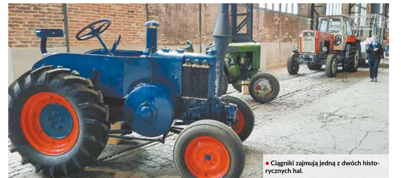
• Ciągniki zajmują jedną z dwóch historycznych hal.