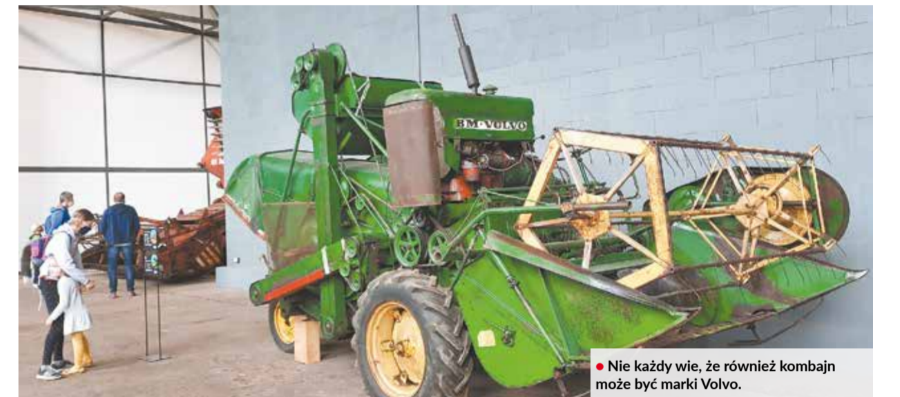
• Nie każdy wie, że również kombajn może być marki Volvo.