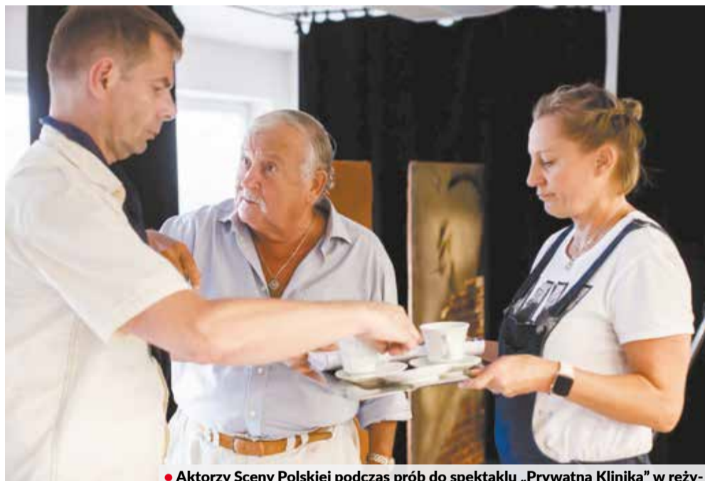
• Aktorzy Sceny Polskiej podczas prób do spektaklu „Prywatna Klinika” w reżyserii Karola Suszki.

kupić w dowolnym momencie trwania sezonu, ale najlepiej zrobić to teraz, czyli jeszcze przed pierwszym spektaklem. Zainteresowani powinni skontaktować się w tej sprawie z teatrem pisemnie lub telefonicznie (tel. +420 558 746 022, +420 604 616 330,