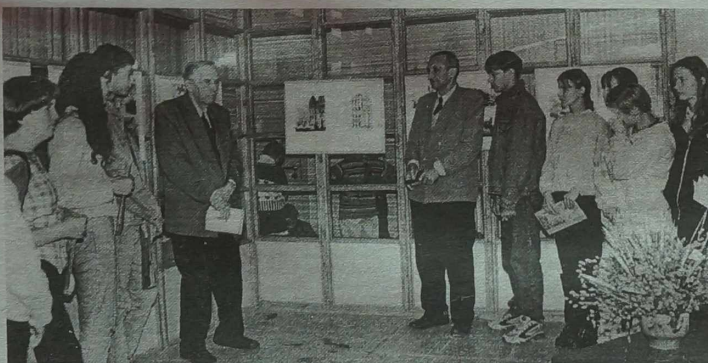
Wystawa w szkole im. Jana Pawła II