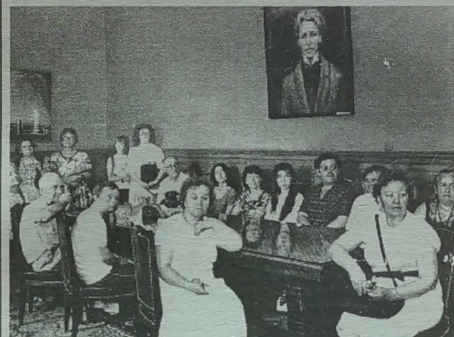
Do uczestników i sympatyków zgadywanki „KW”